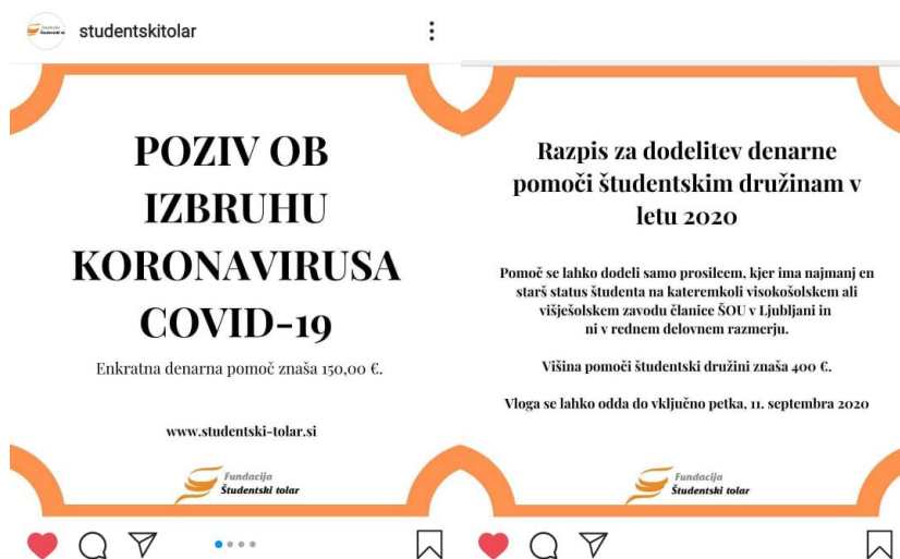
Sliki 5 in 6: Objavi na Instagramovem profilu Fundacije Študentski tolar, kjer uporabljamo oznake #fundacijastudentskitolar, #studentskitolar, #fst in nato predmetne oznake posamezne objave.

Letos smo izvedli tudi anketo o zadovoljstvu študentov z našim delom (povzetek rezultatov je objavljen v našem zadnjem poročilu). Anketo je izpolnilo 92 študentov ŠOU v Ljubljani. 72 % sodelujočih v spletni anketi je bilo zelo zadovoljnih z dejavnostmi, ki jih izvajamo (z najvišjo oceno 5), 22 % pa nam je dodelilo oceno 4 – skupno torej 94 %. Približno tretjina študentov za nas izve preko priporočila ali preko prijatelja, skoraj enak delež pa predstavljajo mediji, druge nevladne organizacije, študentske organizacije visokošolskih in višješolskih zavodov ŠOU v Ljubljani in stojnice na dogodkih. Z rezultatom kratke raziskave o zadovoljstvu svojih uporabnikov s Fundacijo Študentski tolar smo zadovoljni, saj so glede na podane odgovore zadovoljni z našim delom. V odprtem delu vprašalnika smo prejeli nešteto pohval in zahval, obenem pa so v tem delu študenti ponovno poudarili pomen našega delovanja ter izrazili potrebo po še večjem angažmaju naših pomoči – torej še več dodelitev denarnih pomoči, tečajev idr. Področja, ki jih pokrivamo, so socialno občutljiva in zahtevajo hitro odzivnost.