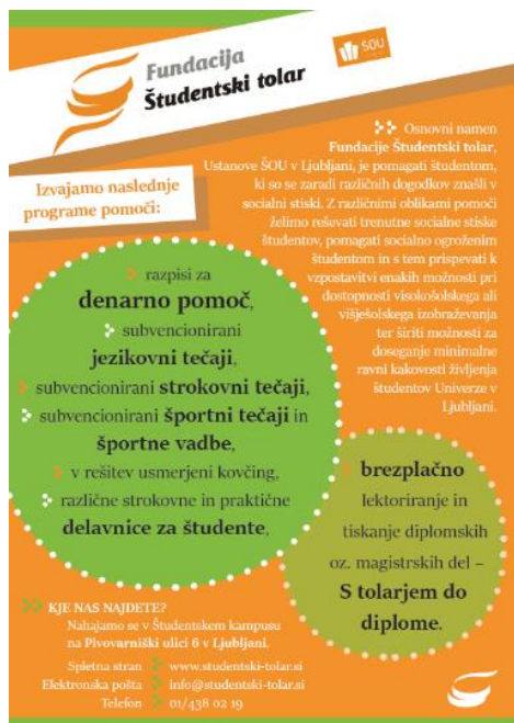
Slika 2 (levo): Letak o dejavnostih Fundacije Študentski tolar, ustanove ŠOU v Ljubljani iz leta 2019.