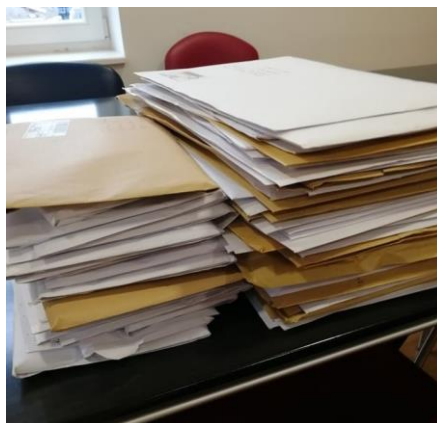
Slika 3: Prejeta pošta v zadnjih dveh dneh našega zadnjega letošnjega poziva za nepovratne denarne pomoči. Po številu vlog in prošnjah vidimo, da je stiska študentov v letu 2020 prav gotovo velika.

Vsekakor si na Fundaciji Študentski tolar želimo in upamo, da bi se finančna situacija prijavljenih študentov izboljšala. Po svojih zmožnostih se trudimo pomagati čim večjemu številu pomoči potrebnim študentom, ki se obrnejo na nas. Vloge ocenjujemo sproti, obenem pa tudi sproti izdajamo odločbe in nakazujemo sredstva.